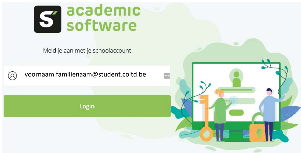
Figuur 1: Inlogportaal Academic Software

De leerling meldt zich aan op https://www.academicsoftware.eu/ met het schoolaccount voornaam.familienaam@student.coltd.be om via dit portaal de beschikbare software te downloaden en te installeren of een licentiecode te verkrijgen.